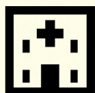
依存症専門 医療機関