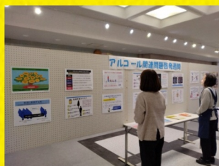
飯豊町町民総合センター

米沢市役所 11月11日(月)～11月15日(金) 飯豊町町民総合センター 11月16日(土)～11月22日(金) 置賜総合支庁(米沢市) 11月18日(月)～11月29日(金)